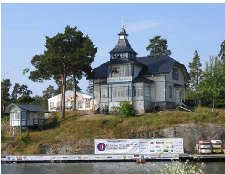
NSS Klubbhus, sett från stora hamnpiren.